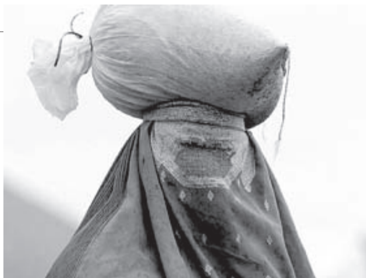
AYUDA. Una viuda afgana trasladada un saco de comida.

—La Cruz Roja es una institución internacional gubernamental creada por un convenio internacional, está presidida por los Reyes, hay presencia de secretarios de Estado e, incluso, un general forma parte del Consejo de Dirección. Goza de privilegios oficiales como el acceso a sorteos de loterías ordinarios y extraordinarios. Por su estatus, no puede considerarse como tal y compite en ese mundo tan confuso. La mezcla de tipologías es tan gigantesca que desdibuja el panorama. Se necesita una clarificación y creo que llegará, tarde o temprano.